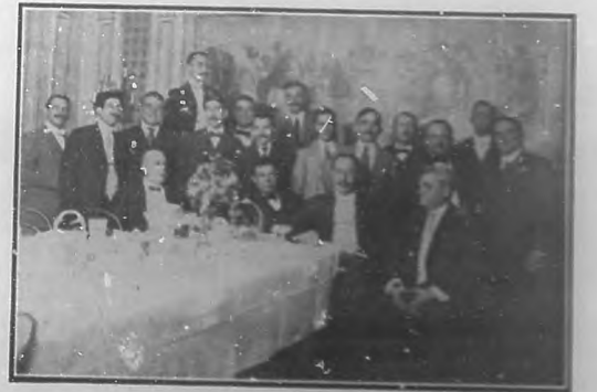
Grupo de cubanos que asistieron al banquete, que por iniciativa de la revista "Cuba en Europa", se efectuó en el restaurant "Martín", de Barcelona, en conmemoración de haberse restablecido en esta isla la normalidad.

El programa era selecto; y del mismo, y de como fué ejecutado ya hablaremos en el próximo número.