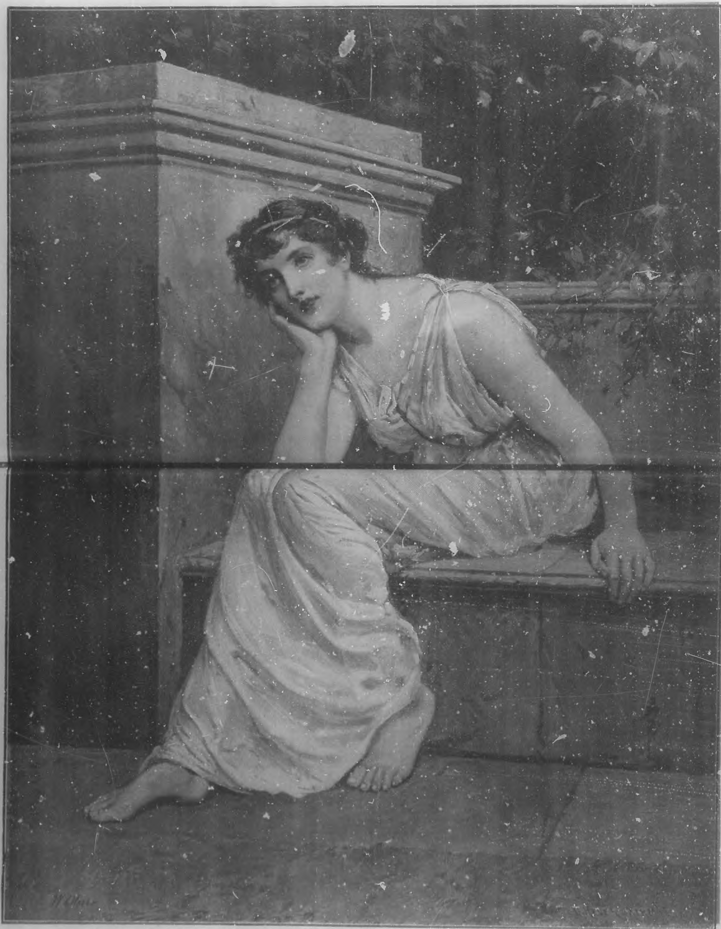
MEDITACION. Cuadro de M. Oliver.